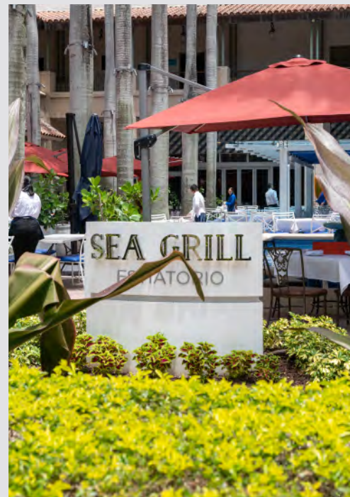
THE SHOPS AT MERRICK PARK